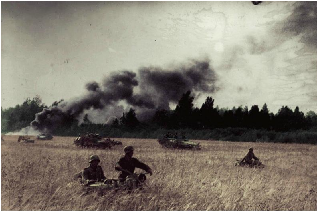
Bild 183-J27512 August 1944

von sowjetischen Truppen gefangen genommen wurde. Man transportierte ihn mit Tausenden Stalingradkämpfern auf der Wolga oder an ihr entlang 520 Kilometer nach Norden zum Lager Nr. 137 in Wolsk bei Saratow – es befand sich am