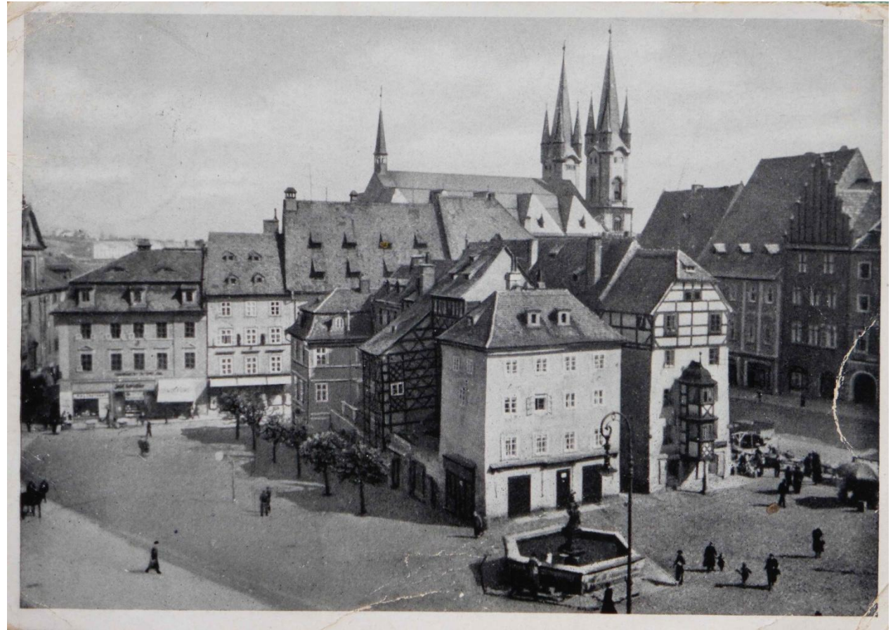
Aufdruck auf der Schriftseite der Postkarte vom 24. 6. 1943: „EGER – Adolf-Hitler-Platz mit Stöckl“