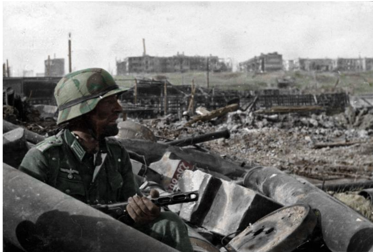
Stalingrad Herbst 1942