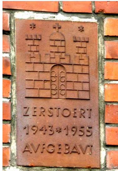
Tafel am Wohnblock gegenüber

Sie kam unter in einer der zahlreichen Schrebergarten-Kolonien der Hansestadt. Vor allem der grüne Stadtteil Wandsbek-Gartenstadt ist bis heute