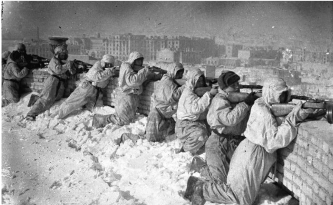
Winterkrieg in Stalingrad