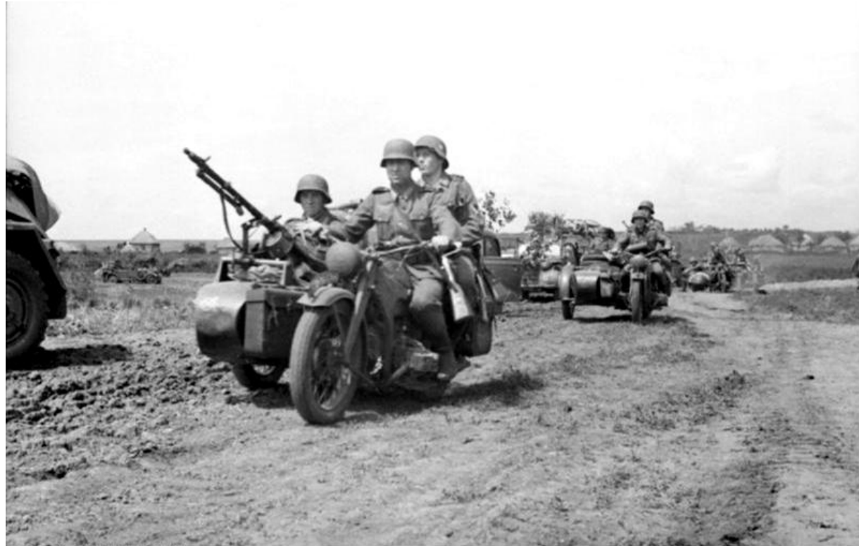
1942 Sommer