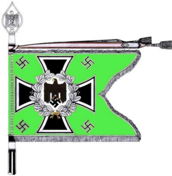
Bataillonsstandarte der Kradschützen